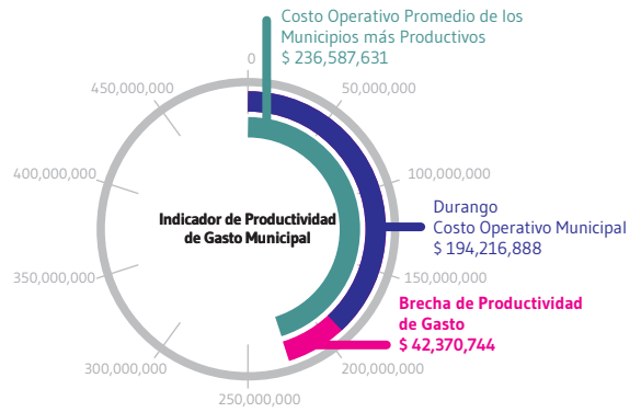
Todas las cifras en pesos corrientes por cada 100 mil habitantes