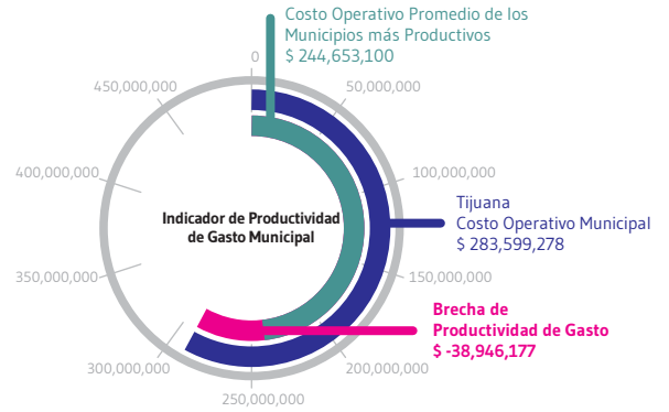
Todas las cifras en pesos corrientes por cada 100 mil habitantes